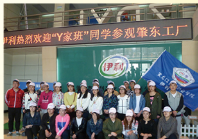
食品工程系学生在企业实习