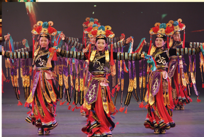
音乐教育专业满族原生态舞蹈 《腰铃》