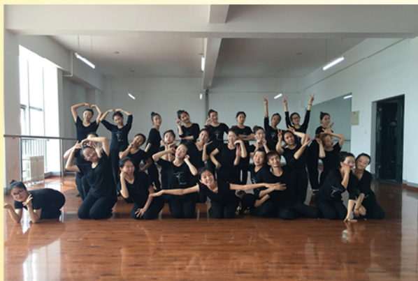
学前教育专业学生风采