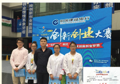
食品工程系的学生参加创新创业大赛获奖