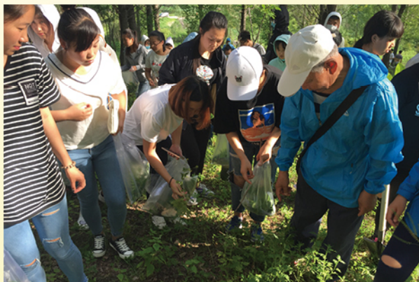
制药专业学生上山采药