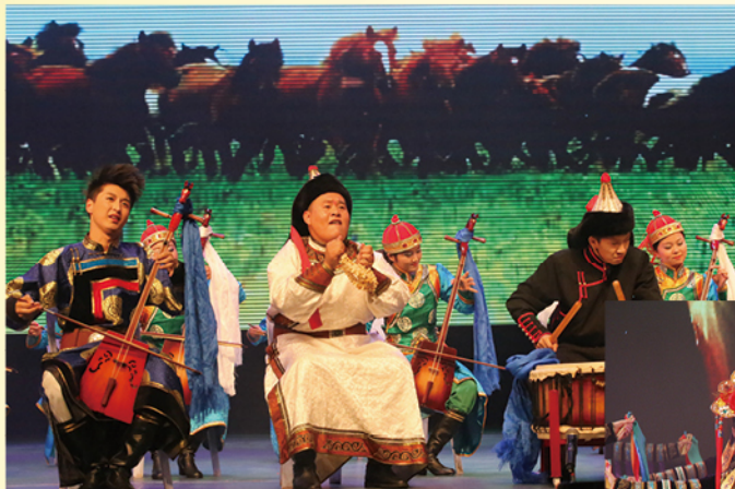
学院马头琴乐团齐奏